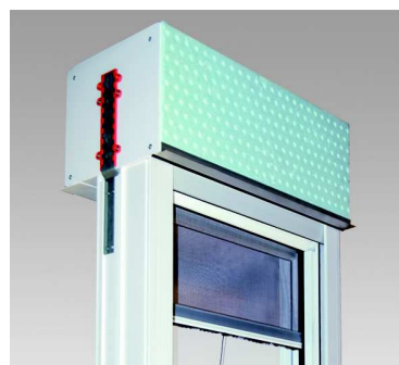
RollTop, raumseitig geschlossen mit Insektenschutzrollo