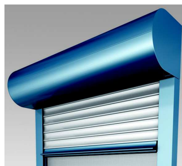
FrontTop II mit integriertem Insektenschutzrollo